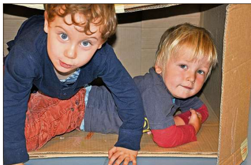
«Cucu!» Far termagls en ina stgatta da chartuna plascha sa chapescha era als uffants da la canorta rumantscha.

Dapli informaziuns: www.canortarumantscha.ch